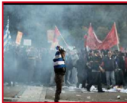
یونان: جرقه ی است در انقلاب اروپا

در اروپا این دید را پیش کشیده که یونان فاقد سیاستمداران معتبر است. سیاستمداران ما با این دید موافقت دارند و به دنبال آندند. در اکثر اوقات در رابطه با ورشکسته گی بانکها اختلاف میان این سه حزب بیشتر در کلام است. اما این بار لائوس از ائتلاف کناره گرفت. مع الوصف، نیمه شب یکشنبه بعد از ساعات بحثهای بی سر و ته و علازم اعتراضات شبانه روزی در میدان سینتگام رهبران احزاب موافقت خود را با شرایط قرض گیری بیان داشتند و مجلس هم رای داد. زدو خورد در سالونیکا، پاترا، وولوس، کرت، و کورفو به وقوع پیوست. اعتراضات علیه بدتر شدن زنده گی مردم و شرایط اجتماعی گسترش می یابد.